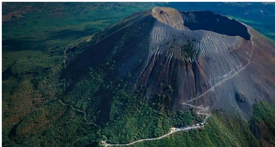
Килиманджаро в Африке